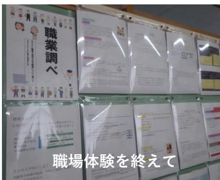
職場体験を終えて