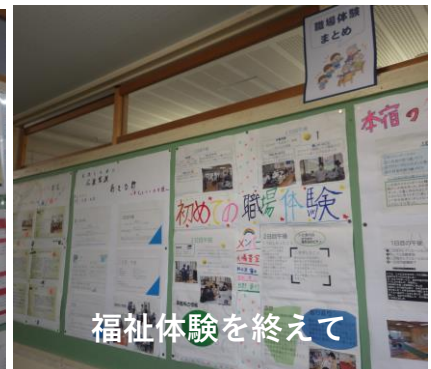
福祉体験を終えて